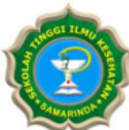
STIKSAM – SAMARINDA