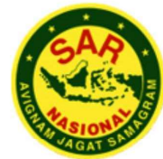
BADAN NASIONAL PENCARIAN DAN PERTOLONGAN