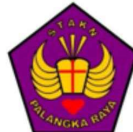
STAKN PALANGKA RAYA