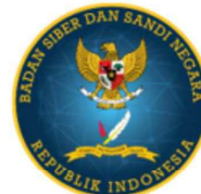
BADAN SIBER dan SANDI NEGARA