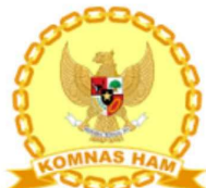
KOMISI NASIONAL HAK dan ASASI MANUSIA