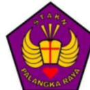
STAKS PALANGKA RAYA