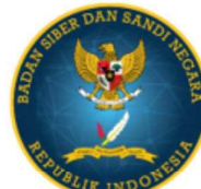
BADAN SIBER dan SANDI NEGARA