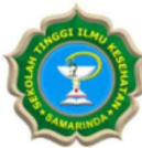
STIKSAM – SAMARINDA