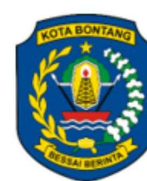
KOTA BONTANG – KALTIM