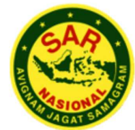
BADAN NASIONAL PENCARIAN DAN PERTOLONGAN