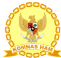
KOMISI NASIONAL HAK dan ASASI MANUSIA