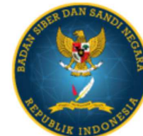
BADAN SIBER dan SANDI NEGARA