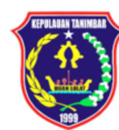
KABUPATEN KEPULAUAN TANIMBAR – MALUKU