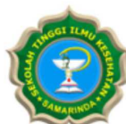
STIKSAM – SAMARINDA