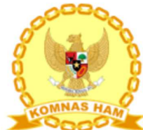
KOMISI NASIONAL HAK dan ASASI MANUSIA