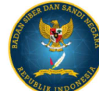
BADAN SIBER dan SANDI NEGARA