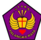
STAKN PALANGKA RAYA